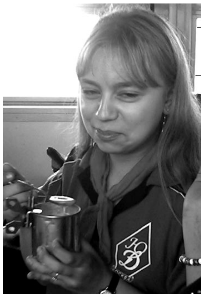
Это точно сгуценка?