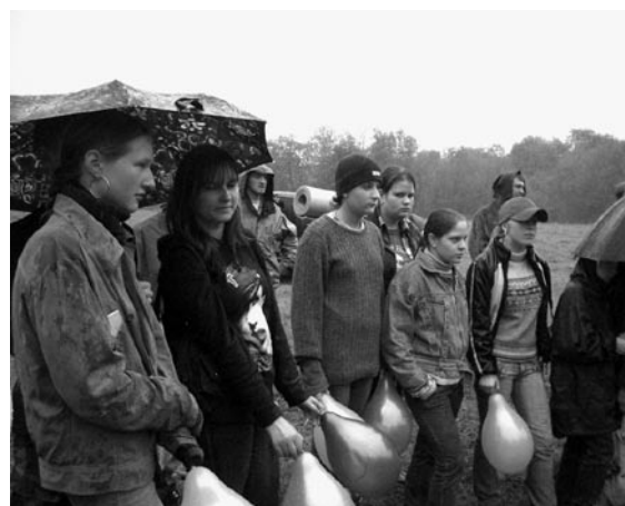
У природы нет плохой погоды... есть очень плохая!