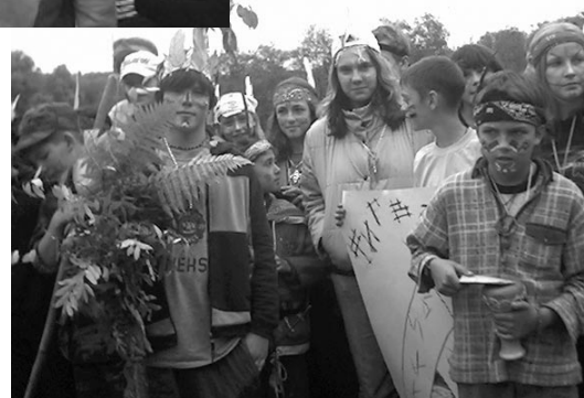
Все команды хороши, выбирай...