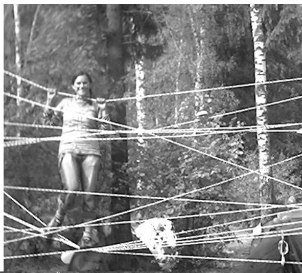
Вот это паутинка!