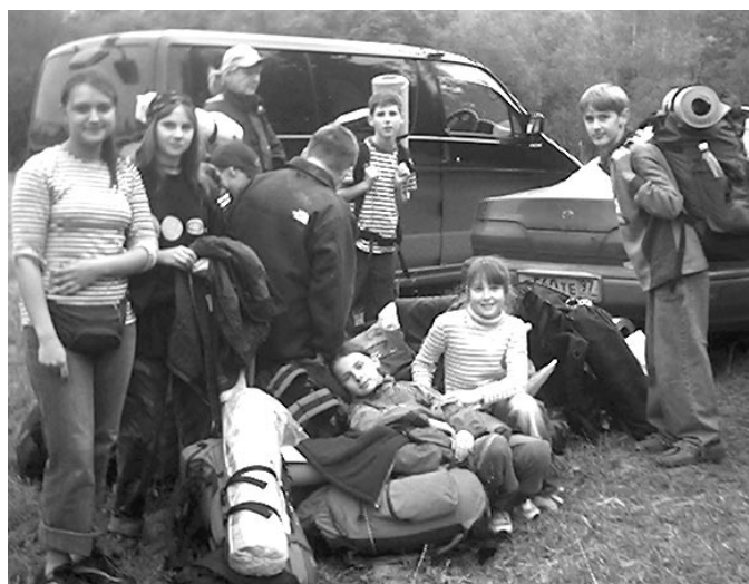
Мы ехали-ехали и, наконец, приехали