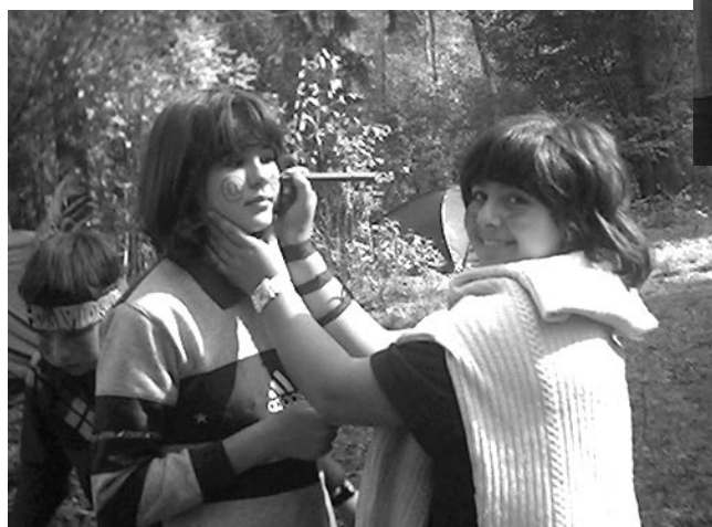
Скажи-ка мне, Тамара...