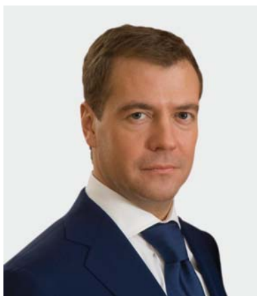
Президент Российской Федерации