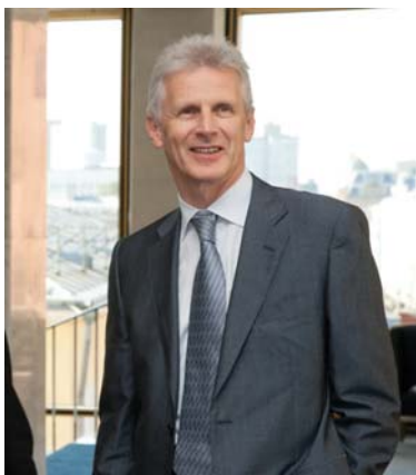
Министр образования и науки Российской Федерации

Рассчитываю, что ваш фестиваль будет также способствовать популяризации исследовательского труда, поможет в укреплении связей между наукой, образованием и реальным сектором экономики.