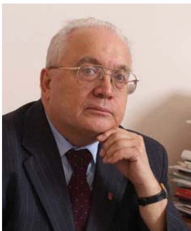
Президент Российского Союза ректоров

Желаю всем участникам фестиваля отличного настроения, новых открытий и творческих успехов!